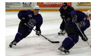
Sidney Crosby and Jack Johnson